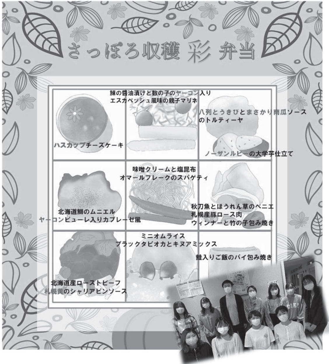
図2. 学生のイラストによるさっぽろ収穫彩弁当パッケージ

施し、多くの利用者のご自身達の意見を反映させたお弁当を手にとって喜びの声を受けとる経験をした。